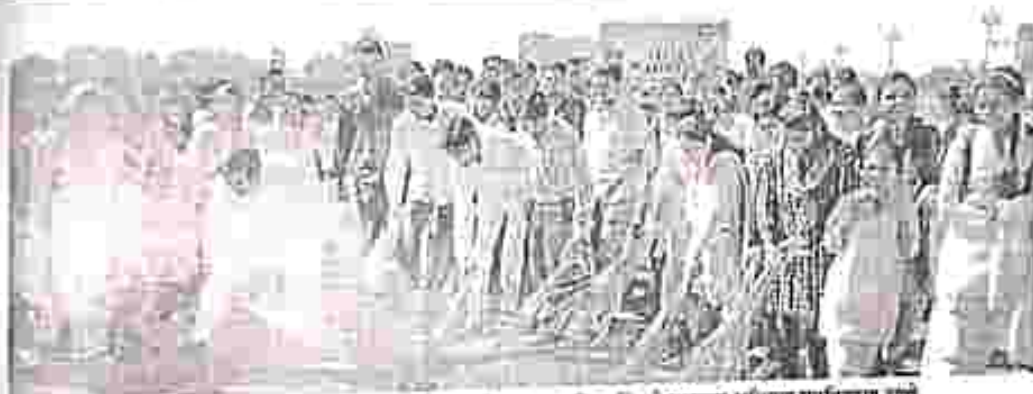
चला गावाकडे उपक्रमांतर्गत प्राखरसांगवीत स्वच्छता अभियान